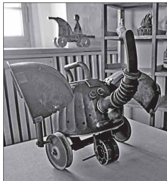
Задорный слон из чайника