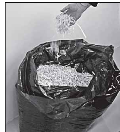
Эта «лапша» секретов уже не выдст