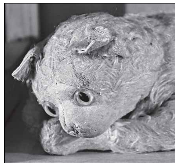
Без кошки - что за новоселье?