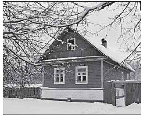
Последний жилой дом в Новичках

имущественно с односельчанами. Убедил их, что дальше так жить нельзя и вопрос с колхозной землёй надо скорей решать, ведь без земли все деревенские с голоду слягут. Требовать же предпочитал с властей, так как их считал виноватыми в развале деревни. Различные пле-