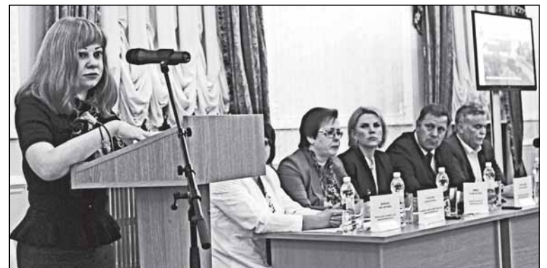
Поговорим про бюджет и Сирию...