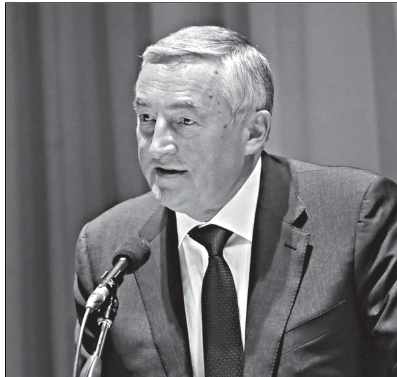
Мэр - мажорен...