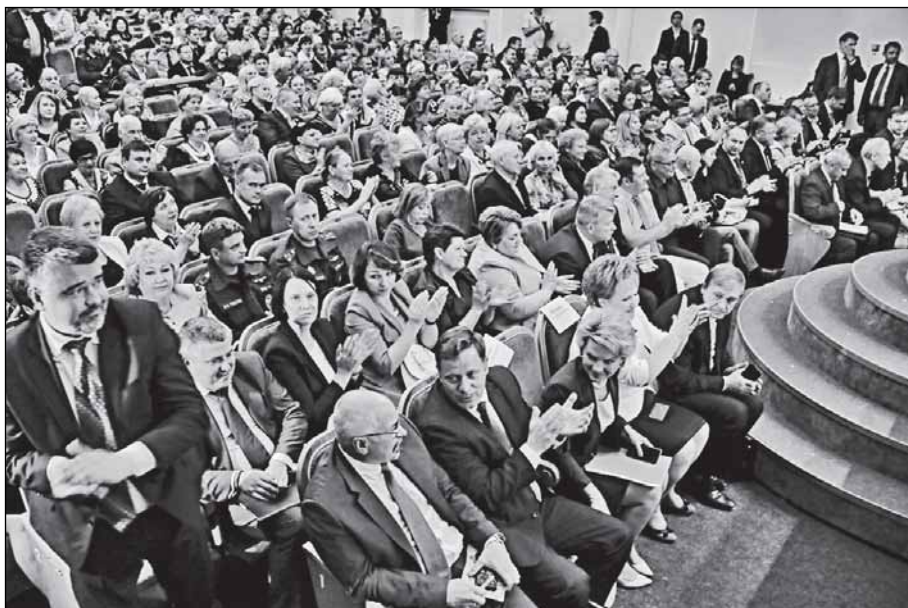
...и «партхозактив» рукоплещет