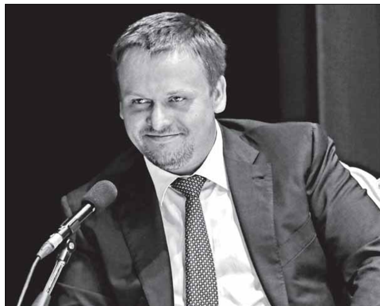
Исполняющий обязанности губернатора доволен...

ляют нервничать чиновного караса, - в зале оказалось меньше, чем в городе. А некоторым из них просто не давали микрофона.