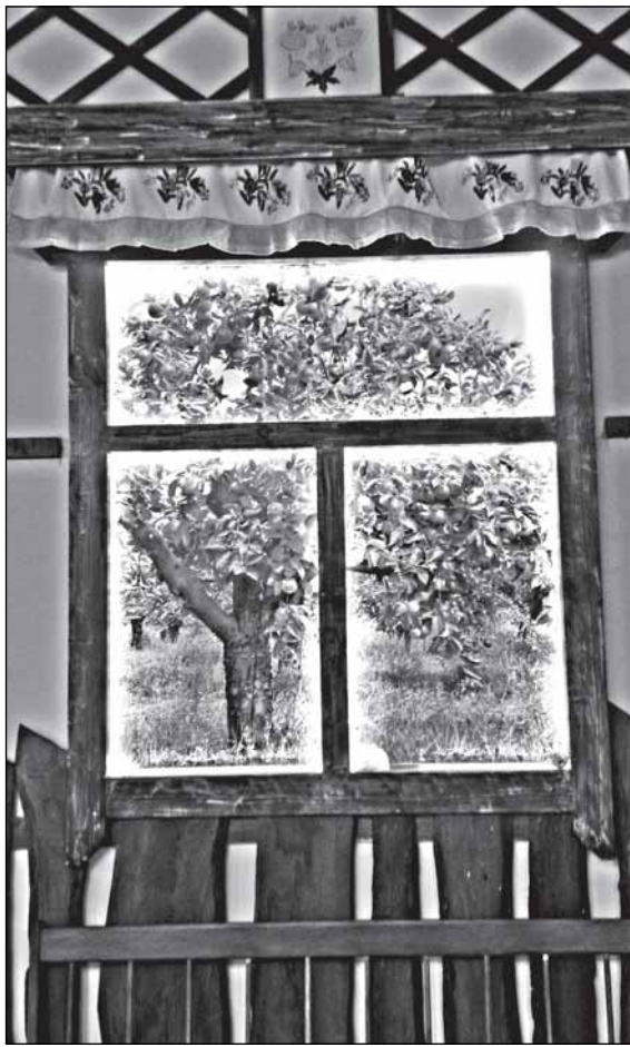
Яблоко как свет в окошке