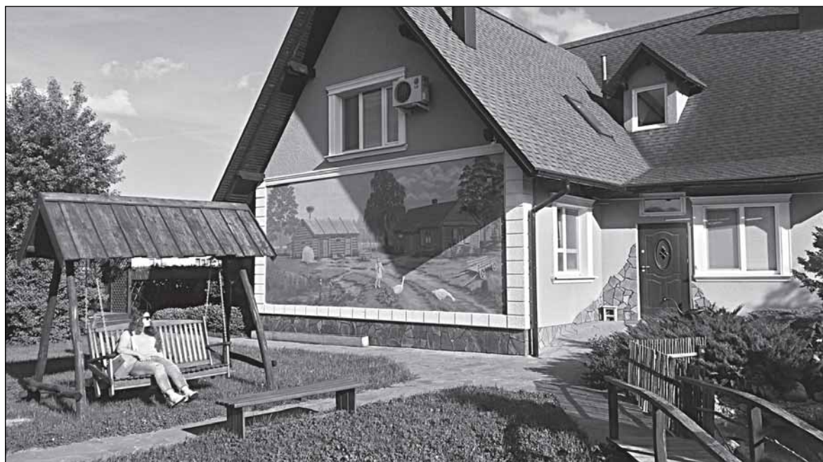
Отдых на все времена