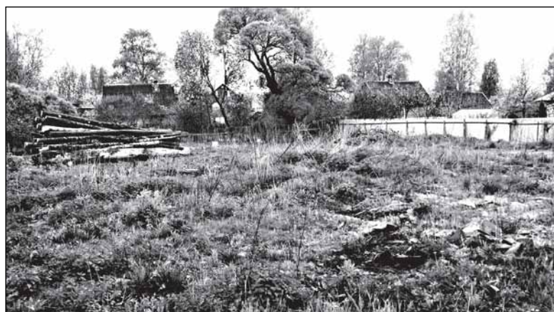
А от дома по Революции, 65 не осталось ничего