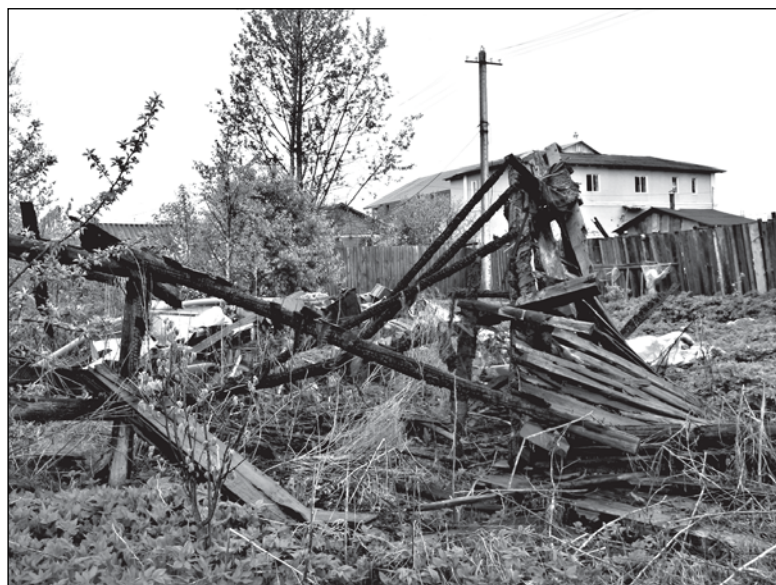
...и по Красноармейской, 13