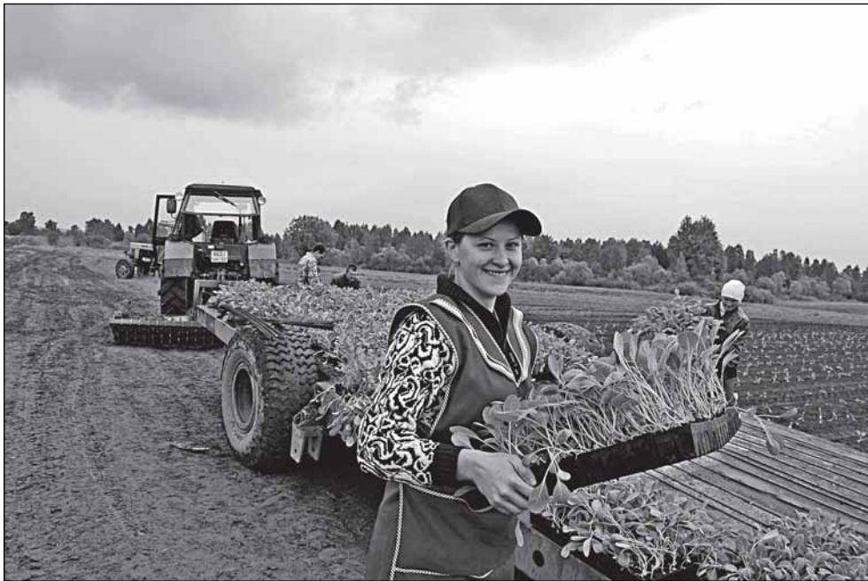
Посадка рассады капусты - дело тонкое

рый в год производит сельскохозяйственной продукции более чем на 30 млн. рублей. Просил же я всего-то 2,5 млн. рублей, чтобы купить картофелекопатель, который на подходе из Германии.