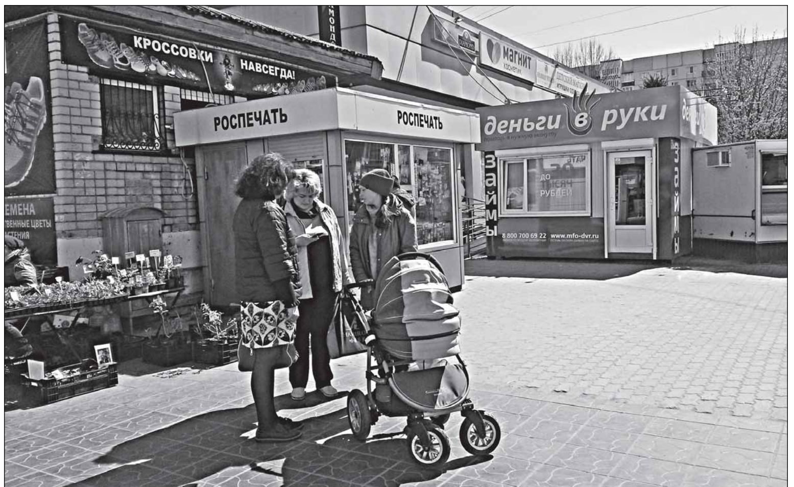
Мамам тоже приходится соображать на троих

При такой арифметике смело можно утверждать, что потенциально 150 тысяч человек, то есть по-