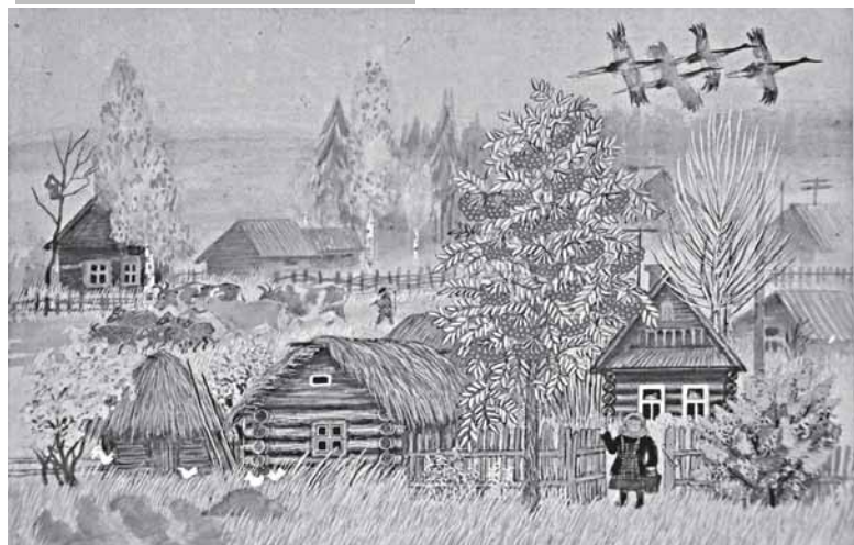
Из иллюстраций к «Мельнице-метелице»