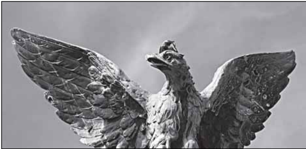
На «Орла» кто-то приземлился. Вряд ли - орёл