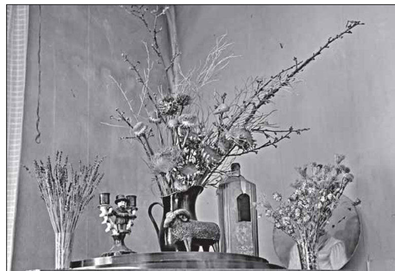
В доме художницы