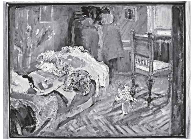
Картина Е. ВАСНЕЦОВОЙ

С 1965 года участница различных выставок: всесоюзных, республиканских, зональных, краевых, областных. С 1973 года член Союза художников СССР.