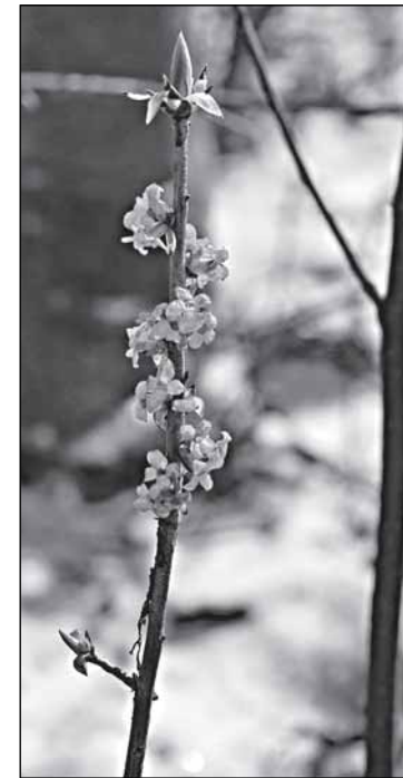
В новгородском лесу зацвело волчье лыко.