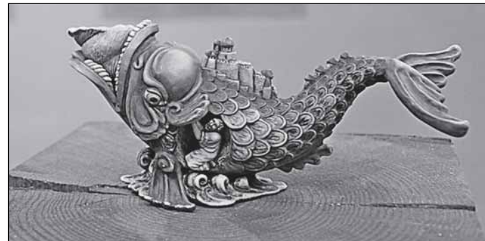
Пятница: Иона во чреве кита

Матросы начинают молиться своим богам. И ничего не происходит. Они зовут Иону. Он говорит: «Это из-за меня». И, чтобы буря закончилась, предлагает сбросить его в воду. Они так и поступают. Буря утихает, корабль уплывает. Но Иону проглатывает чудо-юдо рыба-кит. Он попадает в желудок кита. Никому не советую попасть в любой желудок. Сидит он в этой мерзоте и не соглашается ни на какое милосердие Божие. Он не хочет идти ни в какую Ниневию. Но через три дня сдаётся: ладно, Господи, пойдю. И кит его из-