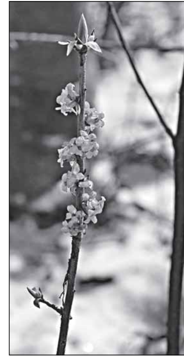
В новгородском лесу зацвело волчье лыко.