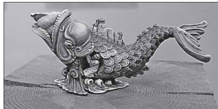
Пятница: Иона во чреве кита

Матросы начинают молиться своим богам. И ничего не происходит. Они зовут Иону. Он говорит: «Это из-за меня». И, чтобы буря закончилась, предлагает сбросить его в воду. Они так и поступают. Буря утихает, корабль уплывает. Но Иону проглатывает чудо-юдо рыба-кит. Он попадает в желудок кита. Никому не советую попасть в любой желудок. Сидит он в этой мерзоте и не соглашается ни на какое милосердие Божие. Он не хочет идти ни в какую Ниневию. Но через три дня сдаётся: ладно, Господи, пойдю. И кит его из-