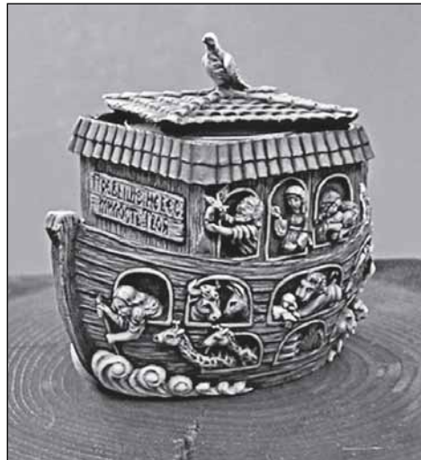
Вторник: Ноев ковчег

– Про Георгия, хотите, расскажу? Видите, там девочка сидит. Если кто-то читал Житие Георгия Победоносца, это история о том, как у одного князя была задача: каждый год одну красивую девочку отдавать Злу. В жизни часто так и происходит. И вот,