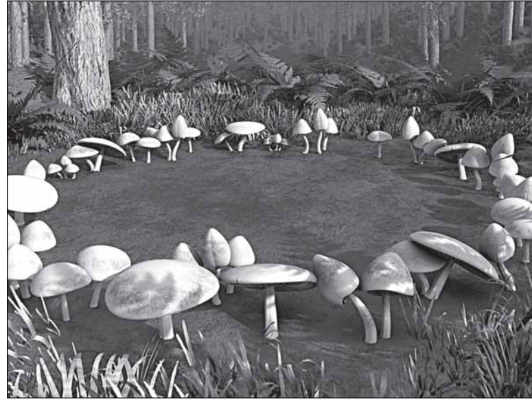
Ядовитые «ведьмины кольца» бывают не только в лесу