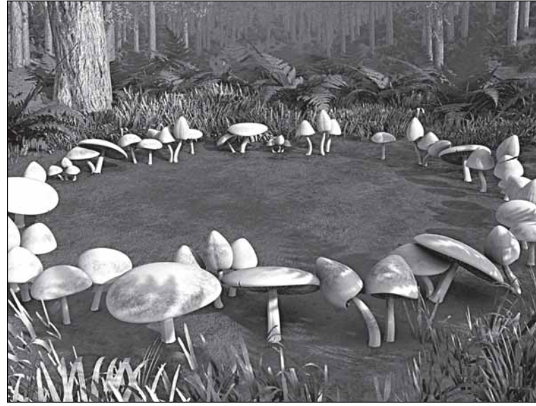
Ядовитые «ведьмины кольца» бывают не только в лесу