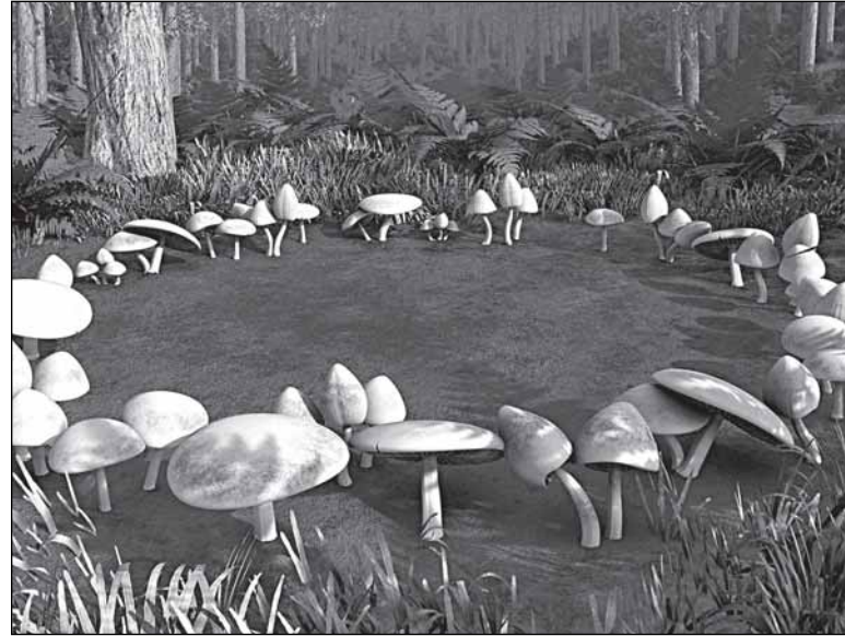
Ядовитые «ведьмины кольца» бывают не только в лесу