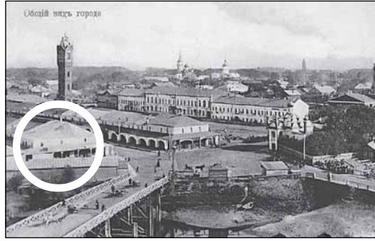
Кружками отмечены предполагаемая стела «Город воинской славы»