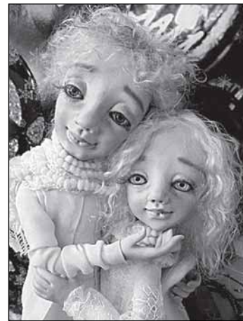
..и её куклы

Но, наставляет меня сын, нельзя быть слишком чувствительными и подверженными влиянию момента, пусть и растянувшегося во времени. Такие жёсткие события могут влиять на всё, в том числе и на отношение к власти. Может придти мысль: