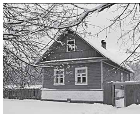
Последний жилой дом в Новичках

имущественно с односельчанами. Убедил их, что дальше так жить нельзя и вопрос с колхозной землёй надо скорей решать, ведь без земли все деревенские с голоду слягут. Требовать же предпочитал с властей, так как их считал виноватыми в развале деревни. Различные пле-