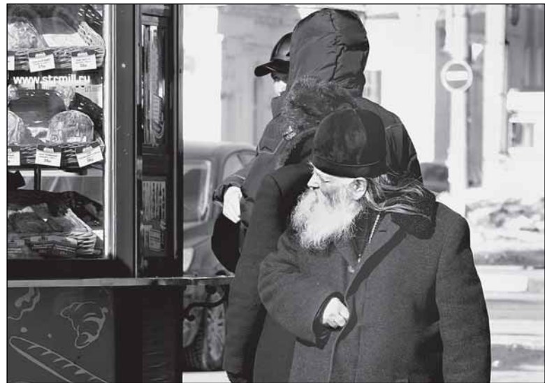
«А постные пироги у вас есть?»

помимо желания открыть бизнес и зарабатывать деньги предприниматель должен понять, как эти самые финансы работают и что они смогут принести через год, например. По крайней мере, в «Мельнице» сделали именно так.