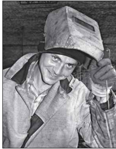
Ты телезритель? Береги глаза!