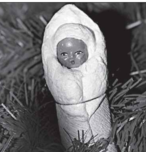
Вот такой примерно младенец...

Прошли десятилетия. Однажды сажусь в Сольцах в автобус на Новгород. Заходит ещё пассажир. Глянула - и сердце вздрогнуло: на его левой щеке виднелось большое родимое пятно. Этот человек сел впереди меня через ряд, поэтому завести разговор было неудобно. Автобус тронулся, и мужчина начал разговаривать с соседом. Сквозь рокот мотора мне всё же удалось кой-что расслышать. Человек сообщил, что всю жизнь работал в Караганде на шахтах, вышел уже на пенсию и вот на старости лет приехал в Сольцы – приехал проведать детский дом, где провёл детство. Надо же, я не ошиблась! Но сосед бывшего детдомовца оказался неразговорчивым, и беседа вскоре сошла на нет.