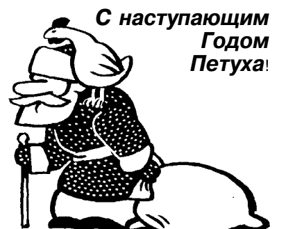
С наступающим Годом Петуха!