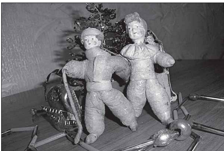
Довоенные ёлочные игрушки: лыжница (похожая, впрочем, и на игрока в хоккее с мячом) и Петрушка

весьма грубую бумагу. Основное содержание рисунков – зимние забавы деревенских детей. К ним хорошо подходило слова известных стихов Ивана Сурикова: