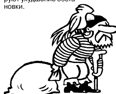
Рисунок: Алексей КРИВОКУРЦЕВ («Красная бурда»)