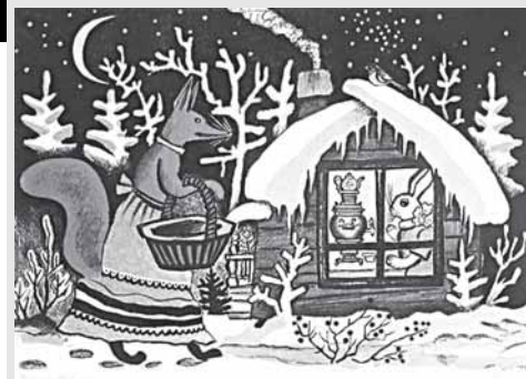
«Как мне не плакать? Была у меня избушка лубяная, а у лисы ледяная. Попрошайка она ночевать, да меня и выгнала». («Лиса и заяц», русская народная сказка)