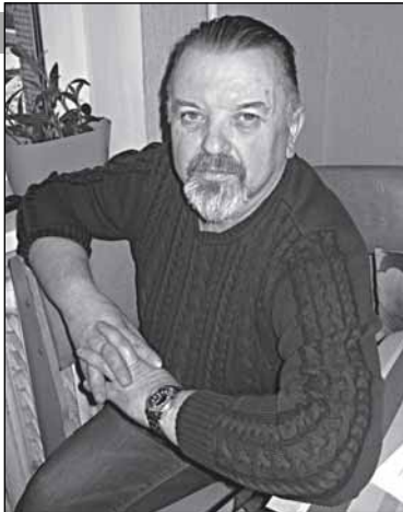
Адвокат Ровбо: «Мне показали, кто есть кто!»

- Я вошёл внутрь, - рассказывает адвокат, - смотрю: пакет на том же самом месте. Взял его, собирался выйти на улицу. Но сделать это мне не дали: вдруг появились приставы, ухватили меня за руку, и всё: уйдёте, мол, только тогда, когда напишите расписку, что взяли этот пакет. Только потом я узнал, что за время моего отсутствия из-за этого пакета был поднят такой переполох. Мне вновь стало нехорошо. Я вновь был вынужден выз-