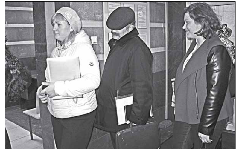
Очередь - не за колбасой... За правосудием!

Эта история получила уже большую огласку в адвокатском сообществе. Ибо проецируется она не на отдельно взятого адвоката. Мы-то, журналисты (как, кстати, и прочие