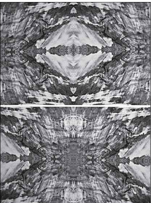
Леонардо Бенчини «Крик внутри»

Искусство Бенчини требует погружения - как в воду с головой, разрывая все связи с естественной средой обитания. Здесь - другой мир. Не отражение, не символ, не аллегория. Но нечто принципиально иное. В этом и заключается творческий метод Бенчини: встряхнуть сознание зрителя, столкнув его с чем-то неизвестным. С тем, что даже не имеет названия. С тем, что - вопреки свидетельству фоторафии - даже не существует, но обретает существование,