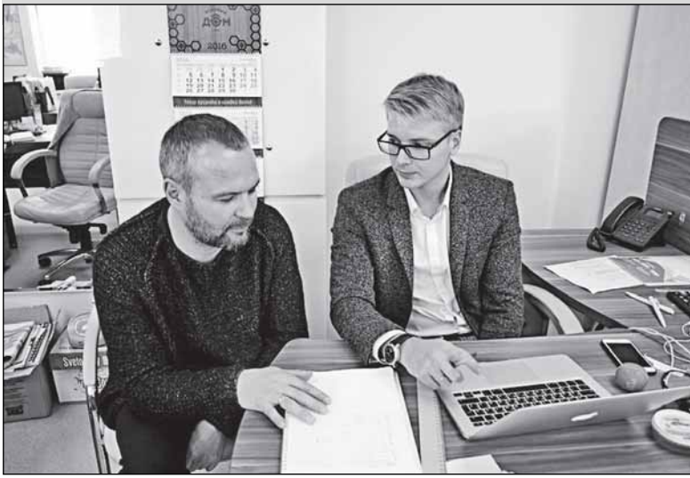
«В основном у нас работает молодёжь...»

мещений, мы оборудовали класс и оформили его в стиле фабрики. Купили мебель, учебную доску, подарили занавески от «Крестецкой строчки». Оказываем помощь и спорту, и ветеранам. Будем, конечно, посёлку помогать, но расходы не будут сопоставимыми с расходами в деревне Мойка.