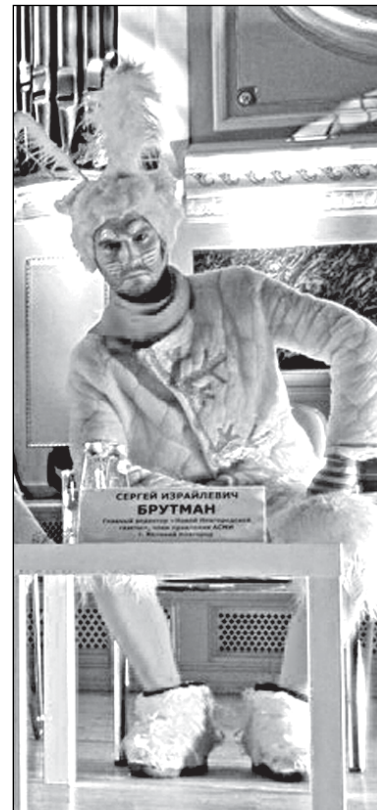
«ННГ» теперь руководят «белые человечки»?