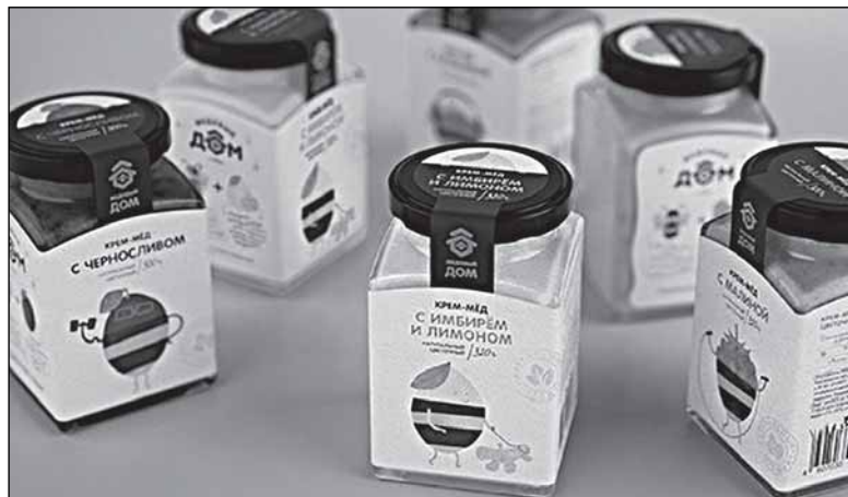
Новые этикетки с пчёлками-ягодками