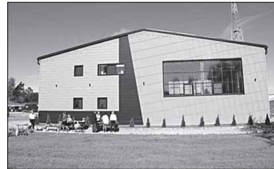
Спорткомплекс в Мойке

Окончание - в следующем номере: о «Крестецкой строчке», политике как «отдельном бизнесе» и стоимости часов на руке.