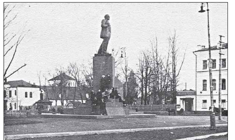
Слева за памятником виден кинотеатр