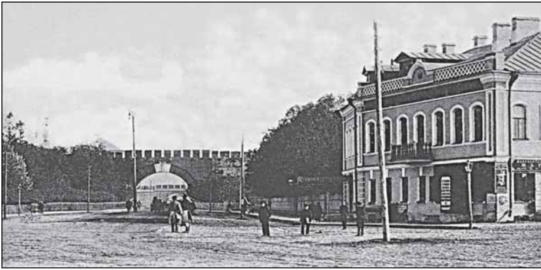
Справа - Софийская гостиница