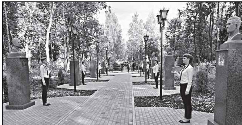
На Аллее героев