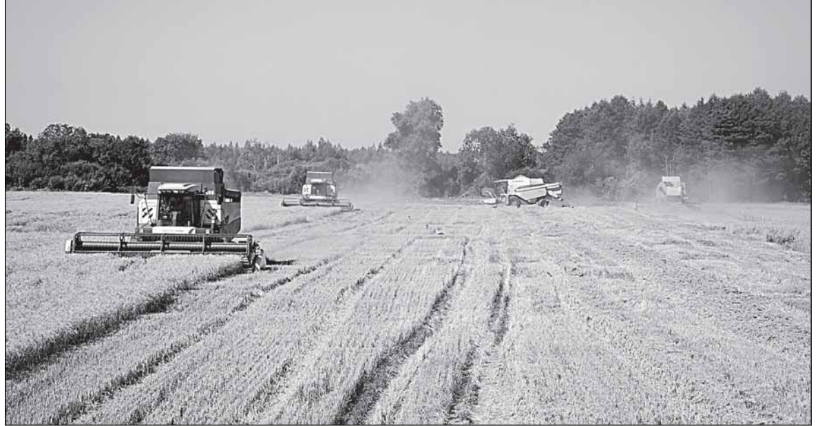
Новгородчина стала вполне «хлебной»